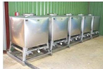
Conteneurs produits liquides